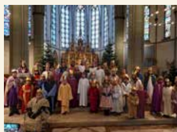
St. Peter und Paul