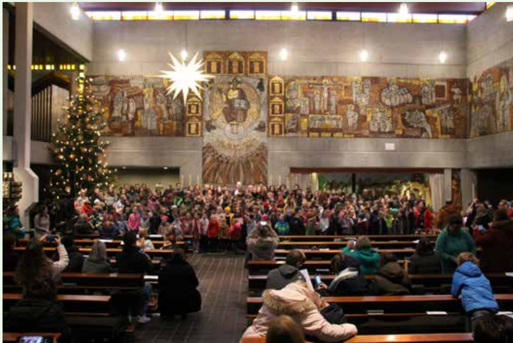
Dankeschön an alle Sternsinger in der Kirche St. Bonifatius