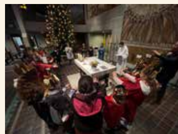
St. Bonifatius/St. Elisabeth