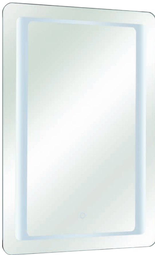
Spiegel mit LED inkl. Touchsensor