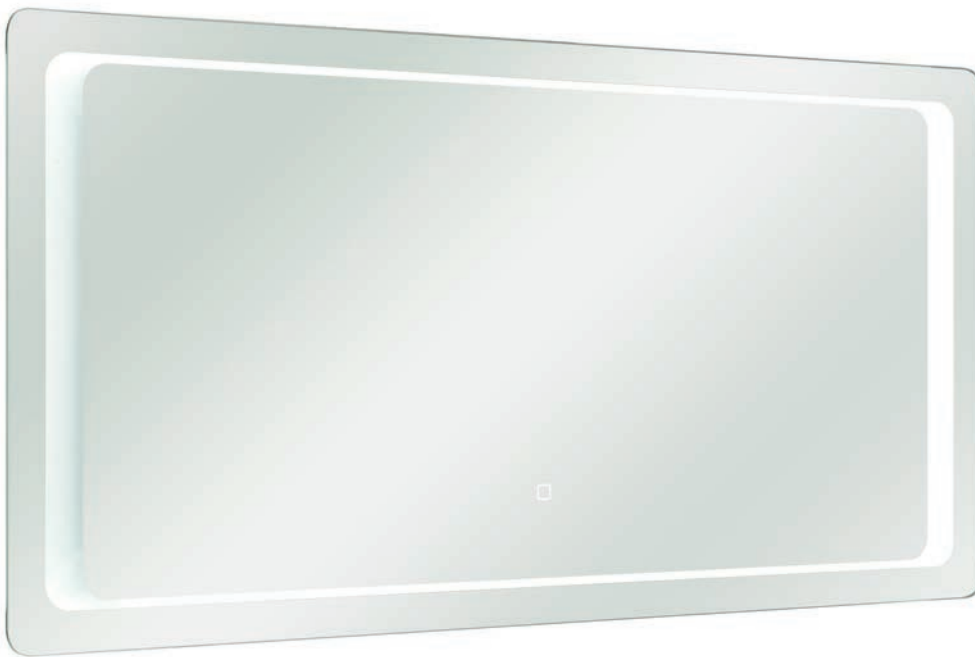
Spiegel mit LED inkl. Touchsensor