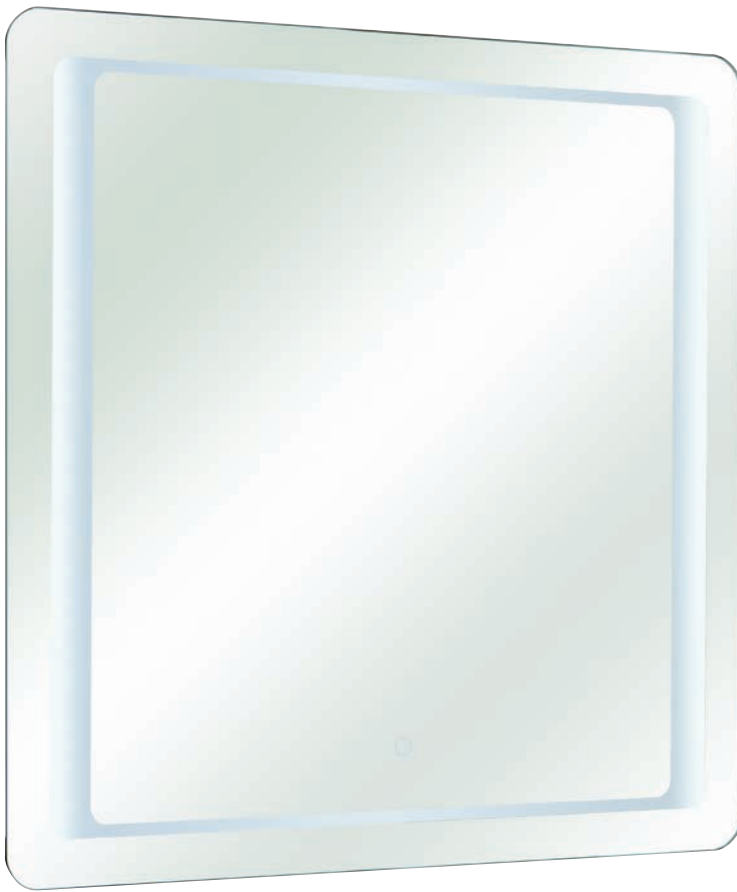
Spiegel mit LED inkl. Touchsensor