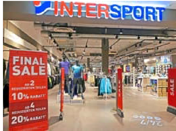
Bei Intersport Voswinkel gibt mehrere Rabatt-Aktionen.