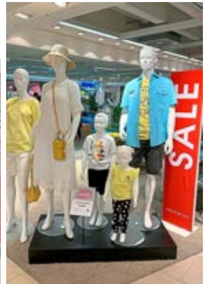
Bei Adler sind viele Kollektionen im Preis reduziert.

F. Klingenthal GmbH · Westernstraße 22-24 · 33099 Paderborn · www.klingenthal.com