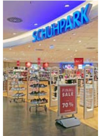
Bis zu 70 Prozent Rabatt bei Schuhpark.