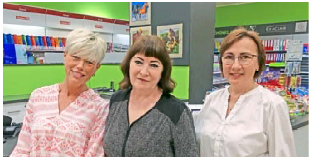
Das Team von Schreibwaren Voss berät Sie gerne beim Kauf des Schulmaterials.