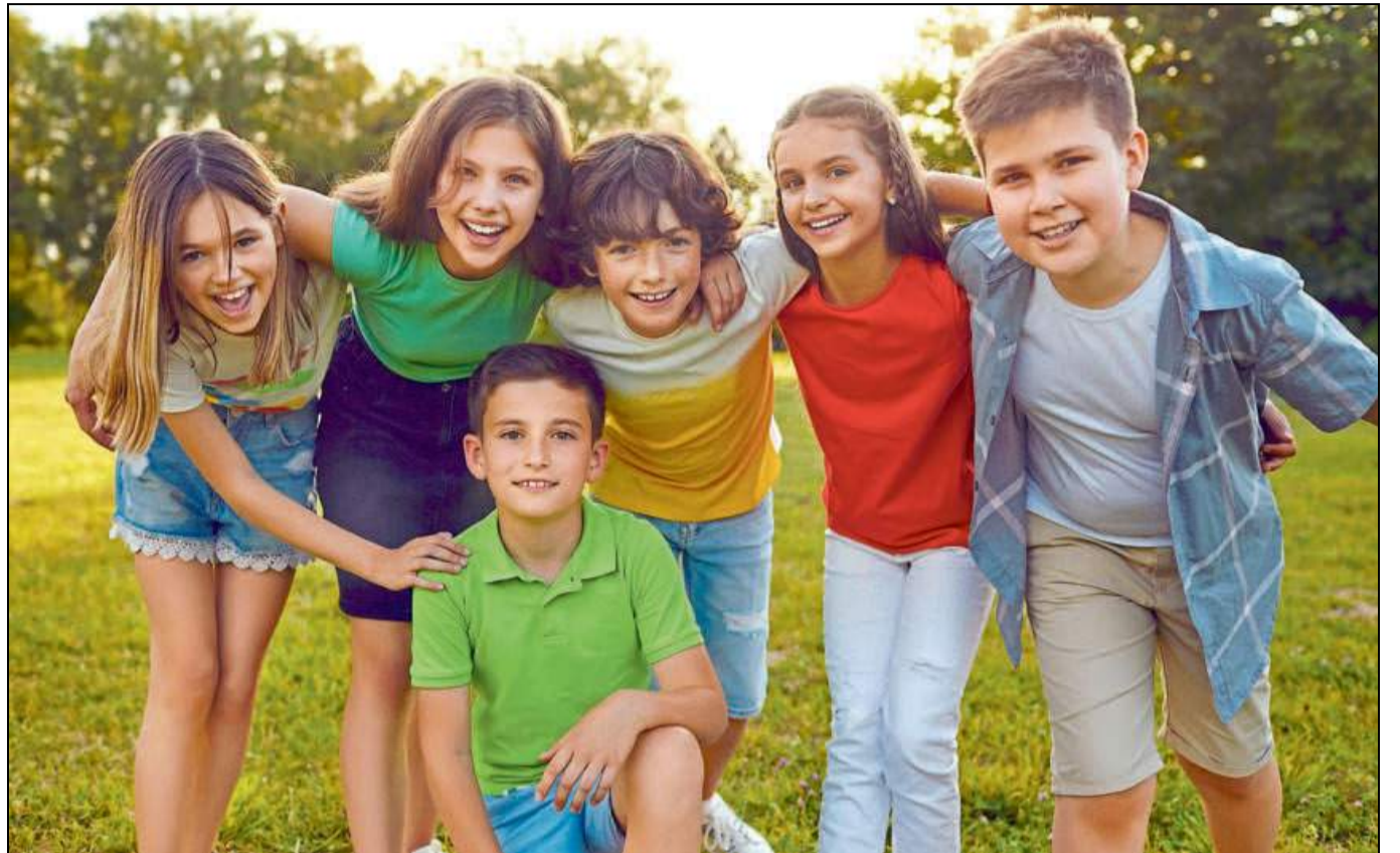
Die Ferien-camps von „Blauer Affe“ bieten viel Spaß für Kinder von sechs bis zwölf Jahren. In der Region gibt es Camps in Paderborn, Salzkotten, Büren, Delbrück, Bad Driburg und Bad Lippspringe.

Die Teilnehmerinnen und Teilnehmer an den Ferien-camps verbringen gemeinsam mit anderen Kindern eine abwechslungsreiche Ferienwoche. Zudem werden die motorischen und sozialen Kompetenzen gefördert. Neben bekannten Sportspielen sowie dem klas-