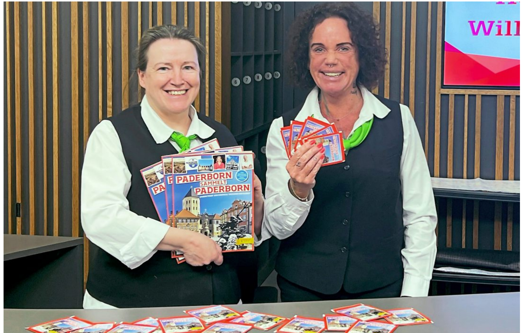
Sammelhefte und Sticker sind an der Center-Information erhältlich.

Jetzt gibt es eine neues Panini-Sammelheft: „Paderborn sammelt Paderborn“. Auf 36 Seiten finden Sie fast alles, was das Leben in der Domstadt und in der Region so schön macht. Das Heftchen ist eine wahre Ode an die Heimat. Sie startet mit einer kleinen Zeitreise durch die Geschichte, zeigt die prachtvollen Gebäude und Kirchen und die berühmten Töchter und Söhne der Stadt. Wissen Sie zum Beispiel, dass es dem Neuhäuser Apotheker Friedrich Sertürner im Jahr 1805 gelang, aus Opium das Schmerzmittel Morphin zu extrahieren? Nicht vergessen wird natürlich das Erzbistum Paderborn, der SC Paderborn 07, die Sportstadt Paderborn mit den vielen Vereinen und Sportanlagen, die Kunst und Kultur oder die besonderen Feste wie Libori und Schützenfest. Das Frei-