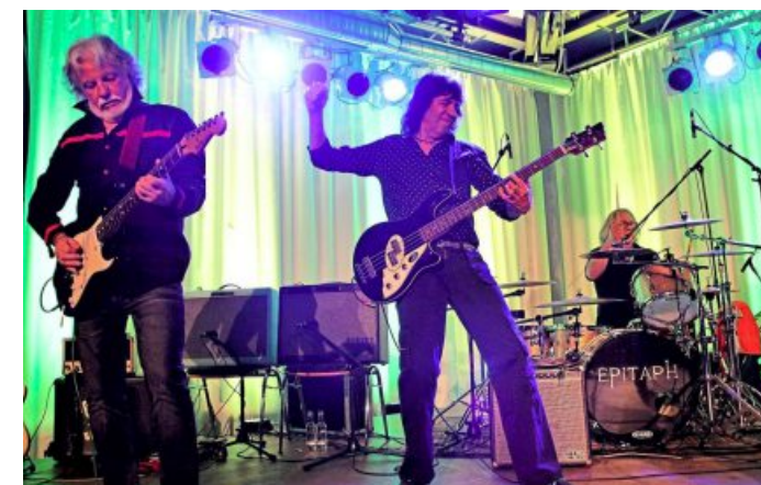
Epitaph sind bekannt für ihren unverwechselbaren Twinguitarsound.

le. Diese nach wie vor aktiven legendären Urgesteine des Krautrock zählen auch heute noch zu besten Live-Acts der Musikszene. Mit dabei sind viele Originalmitglieder und jede Menge bekannte Hits. Wenn Sie bei diesem besonderen Konzert-Ereignis dabei sein möchten, benötigen wir Ihren Kartenwunsch bis zum 7. März. Stichwort: Krautrockfestival. Wie Sie uns den Kartenwunsch mitteilen können, lesen Sie auf Seite 11 im Artikel über die Gewinnspiele in der SÜDRING-Zeitung.