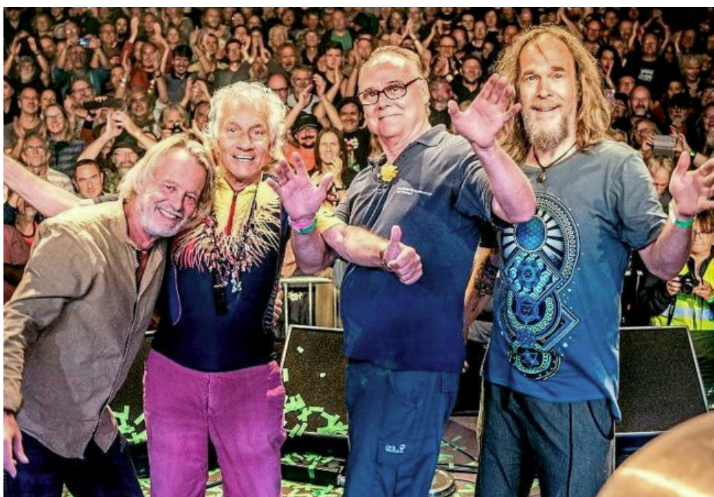
Die extravaganten Guru Guru sind auch in Paderborn dabei.