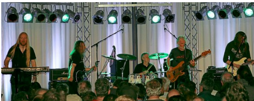
Jane ist eine der beliebtesten deutschen Rockbands der 70er Jahre.