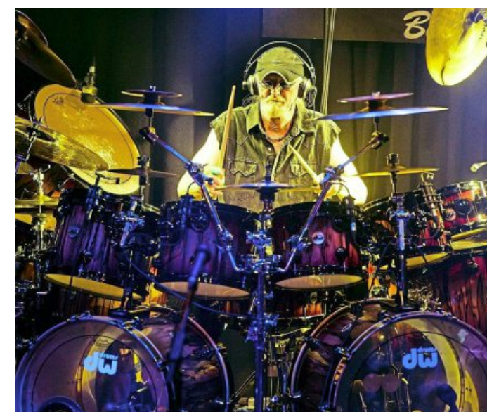
Spielen zeitlosen Progressiv-Rock: Birth Control.