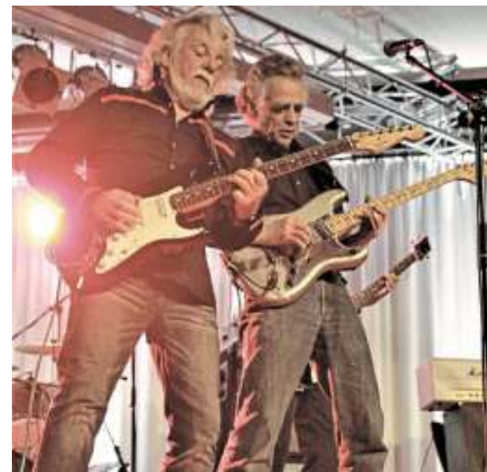
Epitaph ist eine der gefragtesten und kultigsten deutschen Rockbands.