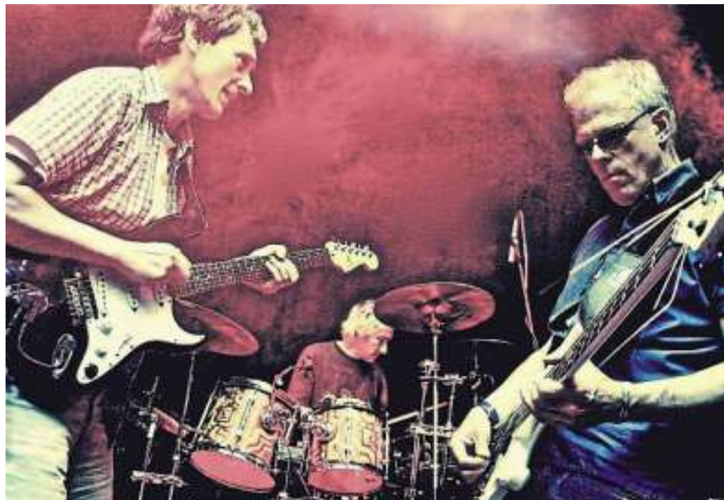
Kraan ist eine der charismatischsten und innovativsten deutschen Formationen.