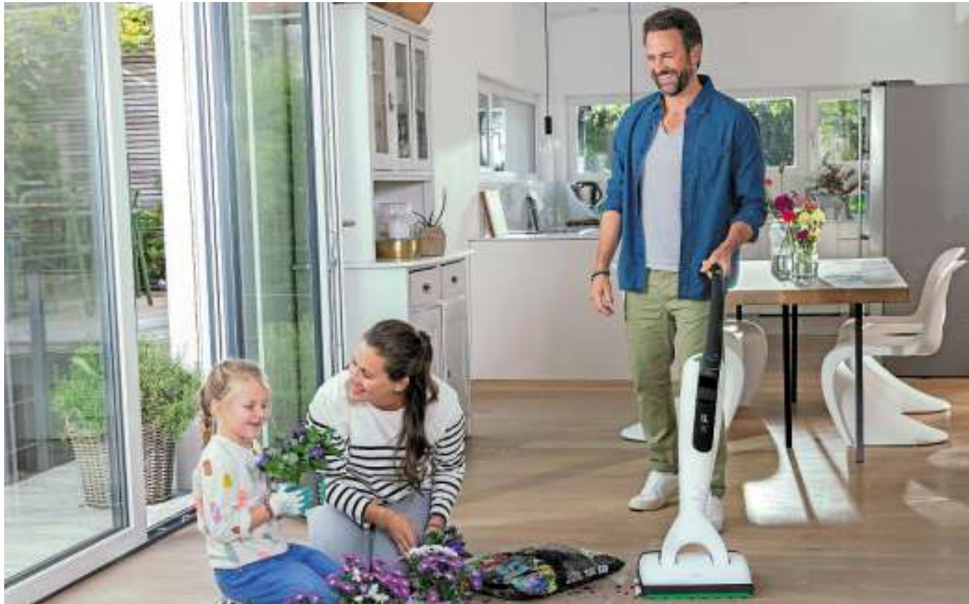
Der Kobold VK7 Akku-Staubsauger von Vorwerk ist von der Stiftung Warentest als Testsieger ausgezeichnet worden.

Der Kobold VK7 Akku-Staubsauger von Vorwerk ist von der Stiftung Warentest als Testsieger mit dem besten Qualitätsurteil ausgezeichnet worden. Im aktuellen Staubsauger-Test „Das Duell: Akkusauger gegen Bodensaugsauger“ erhält der Kobold VK7 Akku-Staubsauger mit der Kobold EB7 Elektrobürste das Testurteil GUT (2,1) und führt damit die Tabelle der kabellosen Handstaubsauger ab „07/2022 Akku-Staubsauger“ an. 140 Jahre Vorwerk – das bedeutet auch 140 Jahre Leidenschaft und Innovation. Der aktuelle Staubsauger-Test der Stiftung Warentest unterstreicht diese Leidenschaft und Produkt-Innovation und zeichnet das Wuppertaler Familienunternehmen mit einem weiteren Testsieg aus. Die Stiftung Warentest Tests des Jahres 2023 bringen aktuell Resultate für 21 Staubsauger – 10 ohne und 11 mit Kabel. Unter den Akku-Staubsauger führt Vorwerk nun wieder einmal das Feld an und erhält für seinen aktuellen Kundenliebling, den Kobold VK7 Akku-Staubsauger mit der