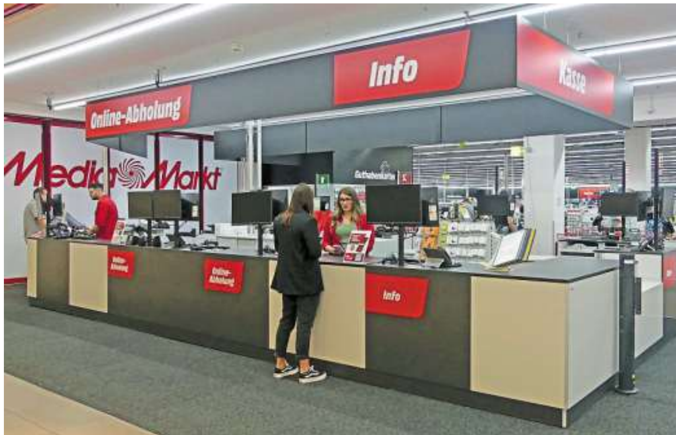
An der modernen Kassenzone sind auch die Online-Abholung und der Service-Counter untergebracht.

Zu den Highlights des Umbaus gehört die geräumige, moderne Kassenzone, an der auch die Online-Abholung und der Service-Counter untergebracht sind. Der Prozess des Bezahleins wird dank des neuen Systems erheblich beschleunigt: „Bisher musste man sich zum Bezahlen jeweils an verschiedenen Kassen anstellen. Jetzt gibt es nur noch eine Schlange für alle Kassen. Die Wartenden kommen der Reihe nach dran, sobald eine Kasse frei wird. So braucht sich niemand mehr darüber zu ärgern, in der falschen Schlange zu stehen,“ erläutert der Geschäftsführer.