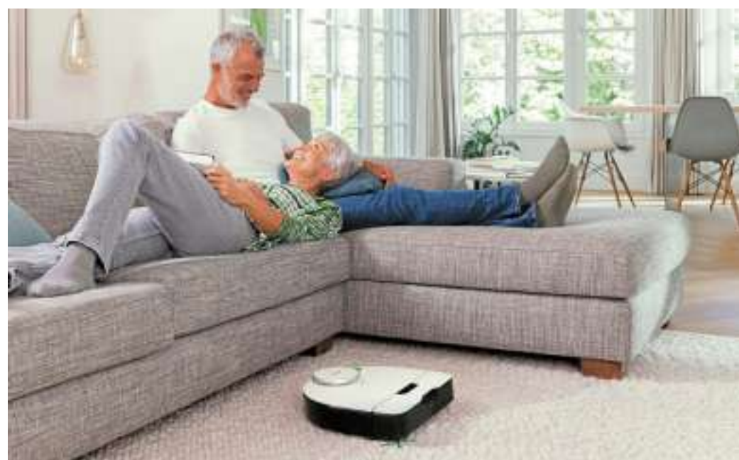
Der Kobold Saugroboter ist leistungsstark, smart und trotzdem einfach zu handhaben.