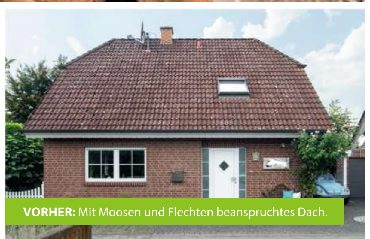
VORHER: Mit Moosen und Flechten beanspruchtes Dach.

Besuchen Sie uns auch im Internet unter: www.bogumil.de