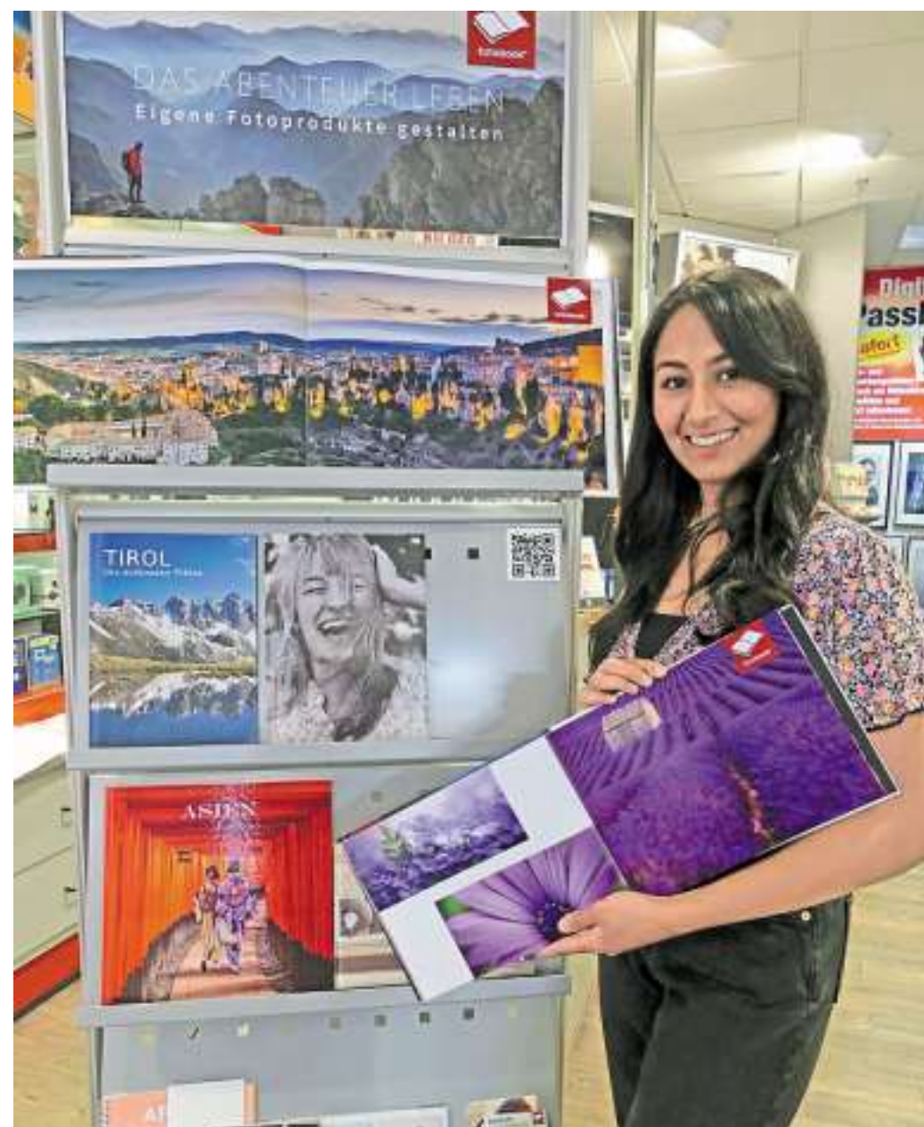
Das Team von Foto Kruse bietet zwei Fotobuch-Seminare an.