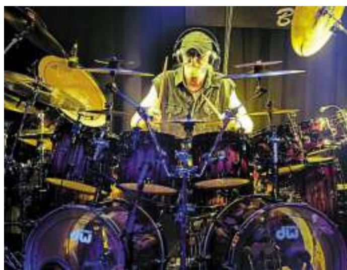
Die Musiker der Band Birth Control haben nichts von der einstigen Ausstrahlung und Spielfreude verloren.

Tickets sind ab sofort zum VVK-Preis von 49 Euro bei ticket@paderhalle.de, info@ticket-direct.de, prorock@paderborn.com und laden@konticket.de erhältlich. Wenn Sie bei der Verlosung der 3x2 Eintrittskarten in der SÜDRING-Zeitung mitmachen möchten, benötigen wir Ihren Kartenwunsch mit dem Stichwort „Krautrockfestival“ bis zum 14. September. Wie Sie uns den Kartenwunsch mitteilen können, lesen Sie auf Seite 9.