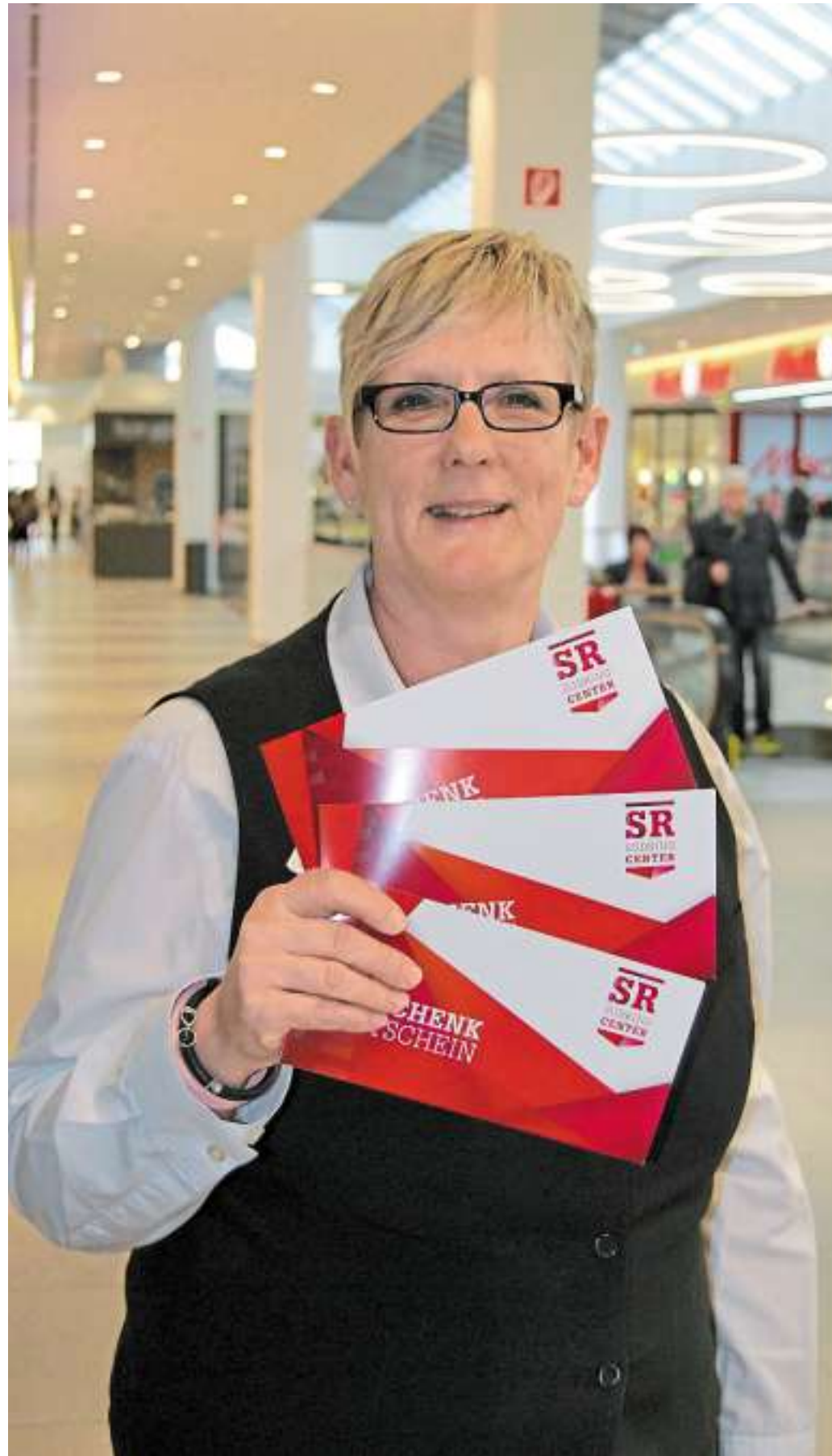
Der SÜDRING-Gutschein ist an der Center-Information erhältlich.

Der SÜDRING-Gutschein ist ab einem Wert von 5,00 Euro an der Center-Information erhältlich. Danach ist der Wunschbetrag frei wählbar.