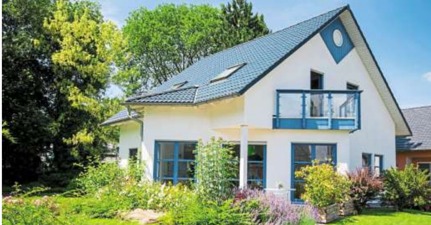
Rund um das Thema Hausmodernisierung informieren zahlreiche Unternehmen bei der Messe im SÜDRING.

Sie möchten ein wenig Abwechslung in die eigenen vier Wände bringen und träumen von einer neuen Decke? Eventuell auch einer neuen Deckenbeleuchtung? Dann sind Sie beim Stand von Plameco Spanndecken genau richtig. Es gibt eine Vielzahl an Möglichkeiten, die bestehenden Decken aufzuwerten. Ganz neu ist auch die Möglichkeit, eine Infrartheizung einzubauen. Das Team verspricht dabei sauberes Arbeiten, so dass sogar die Möbel während des Einbaus der neuen Decke stehen bleiben können. Wenn die Decke neu gemacht werden soll, ist einer neuer Bodenbelag vielleicht