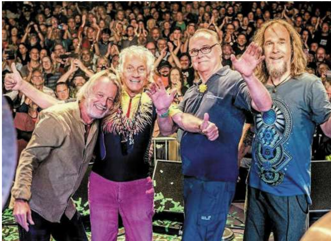
Guru Guru steht seit 1968 für intelligente, kreative und groovige Musik, die zum Glück in keine Schublade passt.

Ende 1970 in Ulm gegründet, zählt KRAAN zu den bekanntesten Vertretern des Krautrock. Ihr musikalischer Verdienst ist die Mischung von Jazz und Rock mit orientalischen und asiatischen Klän-