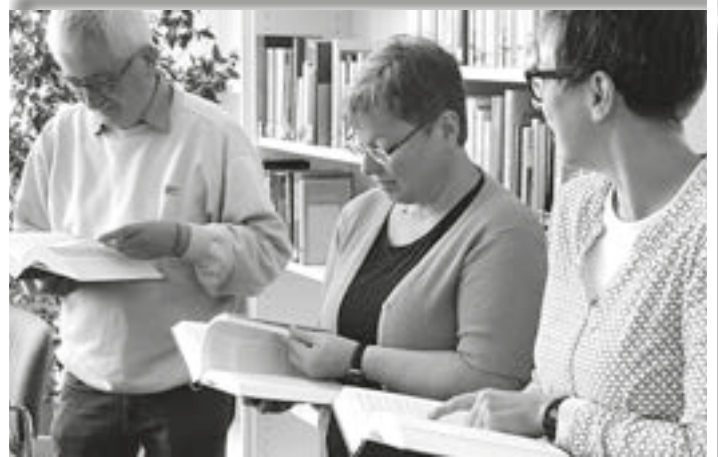
Bild: aus pfarrbriefservice Einheitsübersetzung, kath. Bildungswerk