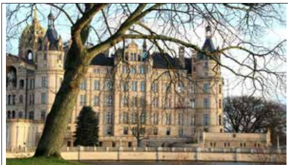
Schloss Schwerin

Nach einer hl. Messe in der kath. Pfarrkirche in Schwerin ist eine Stadtführung vorgesehen. Außerdem wollen wir die Hansestädte Rostock mit Warnemünde und Wismar sowie das Ostseebad Kühlungsborn besuchen.