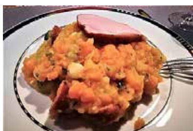
Möhrengemüse mit Beilage

Wann: Son, 10. April nach dem Gottesdienst Wo: im Gemeindehaus St. Marien, Bismarckstraße