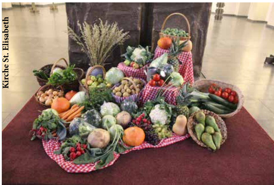
Kirche St. Elisabeth