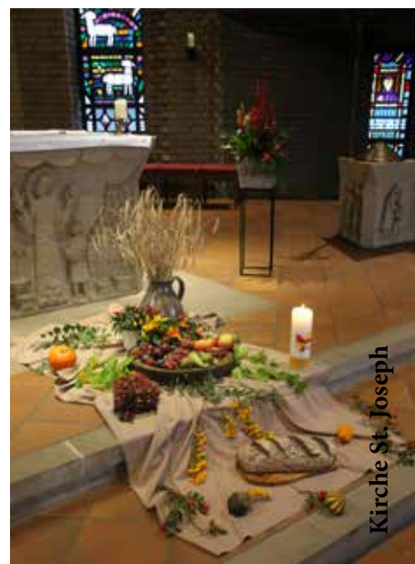
Kirche St. Joseph