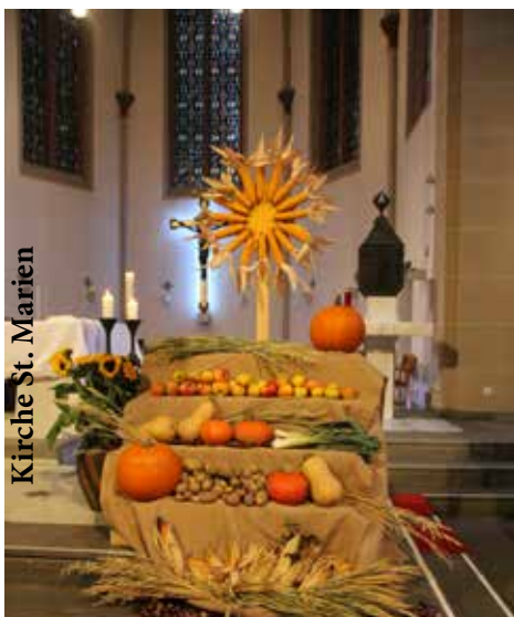
Kirche St. Marien