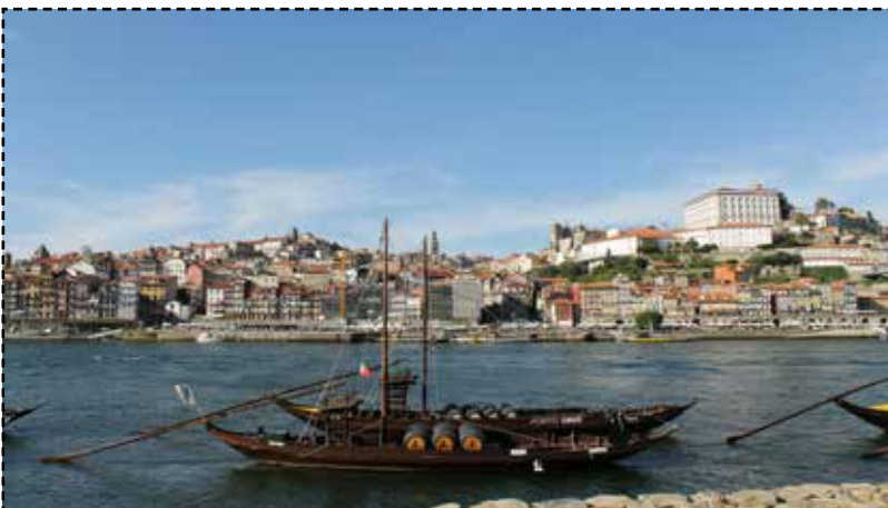
Gemeindefahrt nach Portugal. Näheres entnehmen Sie bitte den ersten Seiten! Bild: Porto - privates Archiv

Kindergruppe: freitags 16:00-17:00 Uhr (9-12 Jahre);