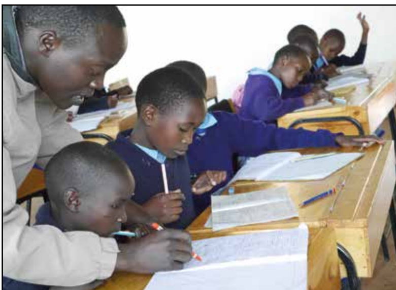
Mädchen eines Internates von NANGINA in dem Ort Kibuk in Kenia

An dem Wochenende 17./18.02. sind etwa 6 Jugendliche in den Gemeinden Herz Jesu und St. Bonifatius in den Gottesdiensten zu Gast.