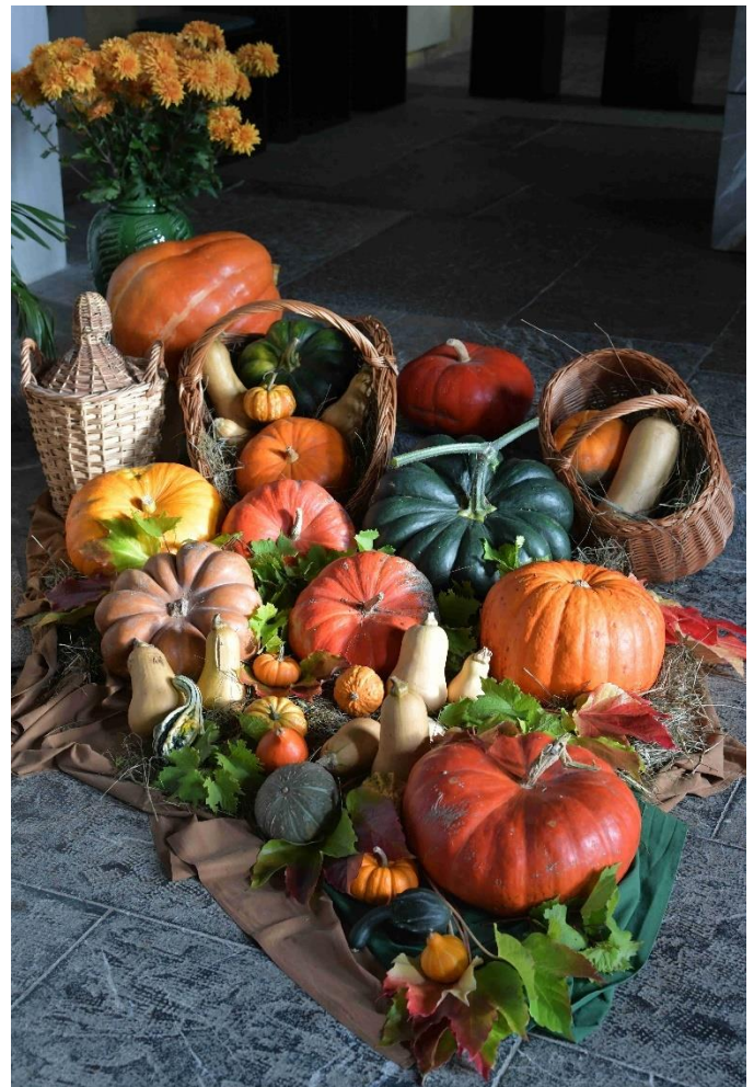
St. Niklausen, Schweiz

„Er wird den Weinberg an andere Winzer verpachten.“