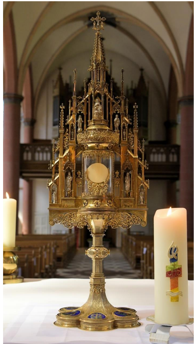
Monstranz St. Martin Bad Lippspringe, Foto: Bernhard Bauer