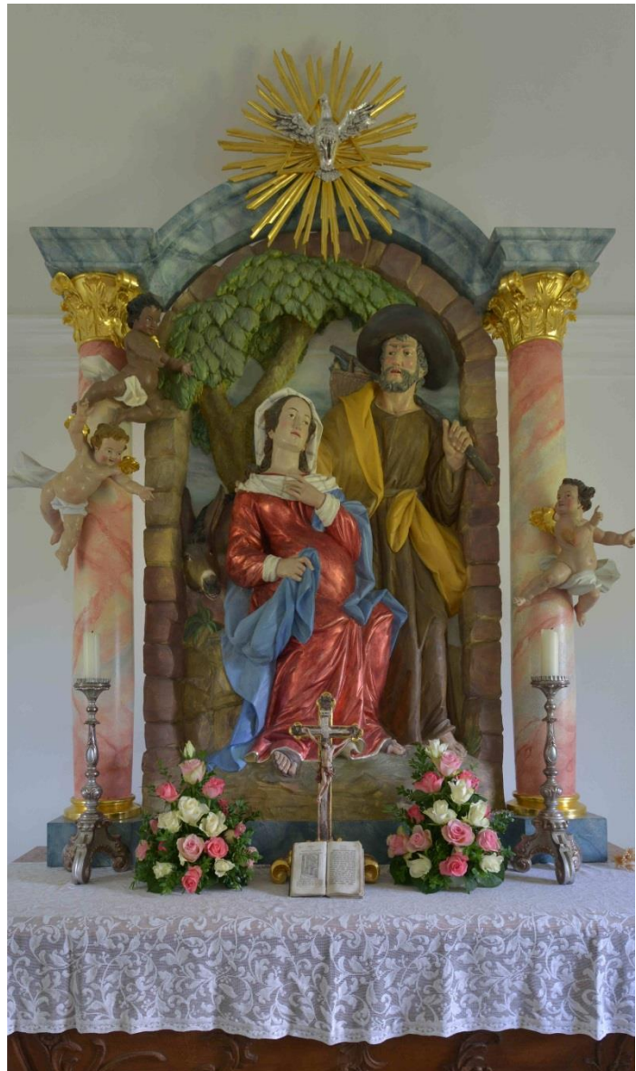
Kapelle Maria Rast in Krün Oberbayern

Einen gesegneten 2. Advent und eine gute Woche wünscht Ihnen und Euch Martina Knoke, Gemeindereferentin