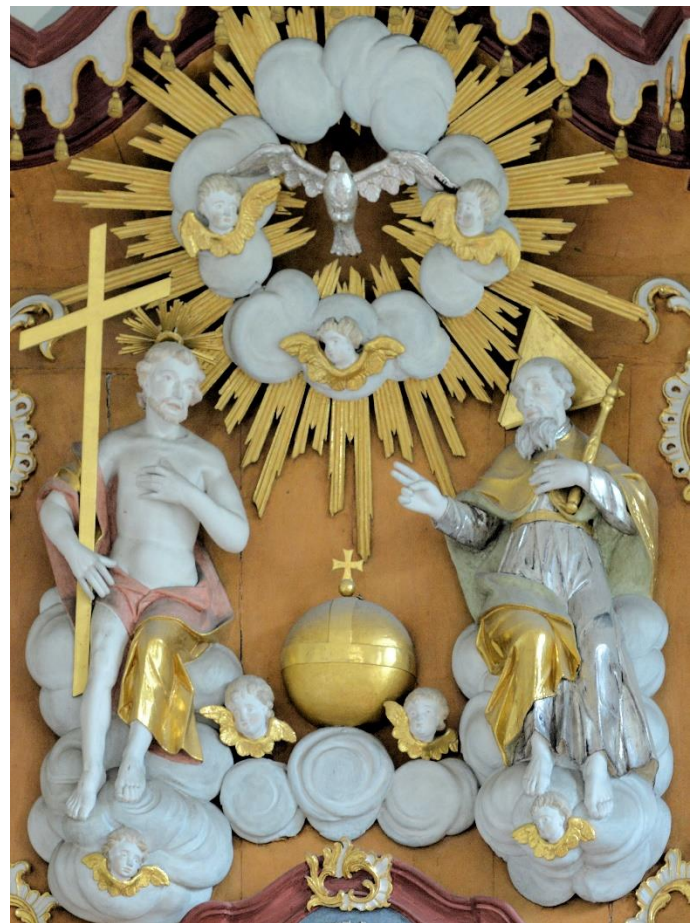
Hochaltar Alte Wallfahrtskirche Werl

„Tauft sie auf den Namen des Vaters und des Sohnes und des Heiligen Geistes!“