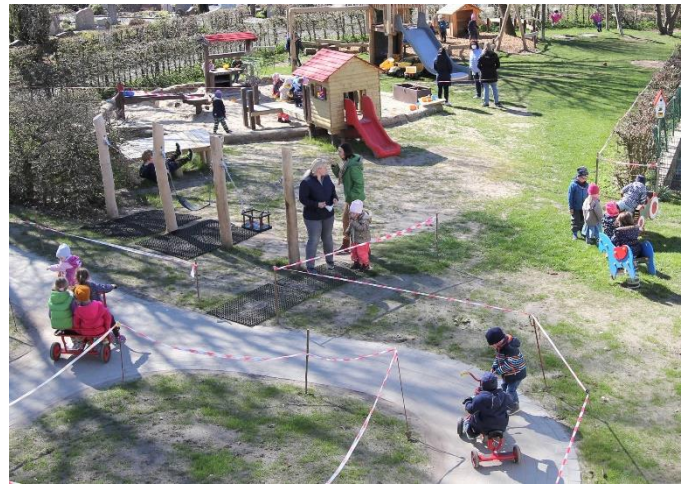
Neu strukturiert wurde das Gelände von der Rennstrecke oben über den Sandkasten und Kletterturm bis hinunter zum Ponyhof und der Schaukel. Die Flatterbänder markieren die zu Corona Zeiten üblichen Trennbereiche der Gruppen